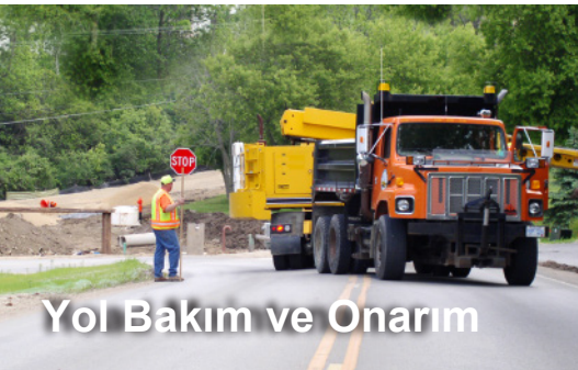
Yol Bakım ve Onarım