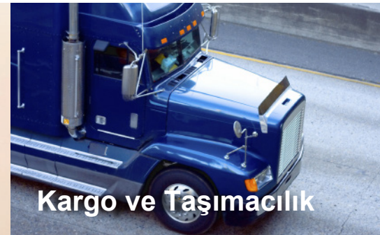
Kargo ve Taşımacılık