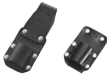
MB-96FL MB-96F Uzun kemer askısı. Sabit tip.