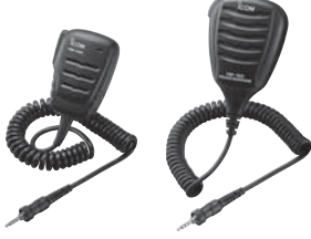
HM-228 HM-165 IPX7 kompakt tip. IPX7 tam boy hoparlör mikrofon.