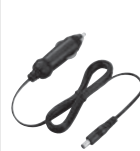
CP-25H BC-220 ile kullanım içindir.