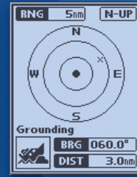
Konum sorgulama ekranı