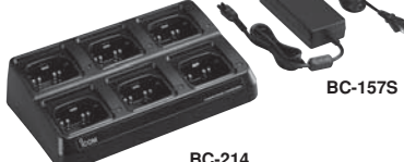
BC-214 BC-157S Altı adet BP-285'i yaklaşık üç saatte şarj eder.