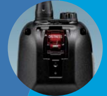
Acil durum çağrı butonu

Cihazın içerisindeki DSC alıcısı sürekli olarak 70. kanalı tarar. Telsiziniz üzerinden acil durum çağrısı ise arka paneldeki buton ile yapılır.