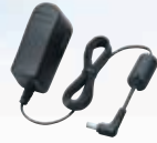
AC adaptör BC-123SE